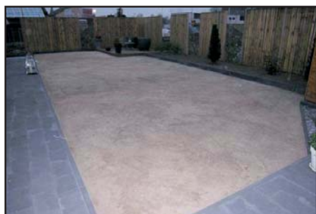
Kontroll av underlag